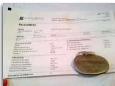
Pacemaker et sa fiche de renseignement.